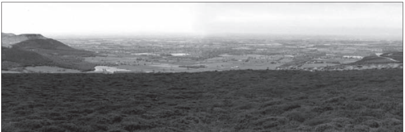
Bloworth Crossing: splitsing tussen de Cleveland Way en C2C-pad