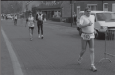
OLAT-successen in Loon PAG 10-11