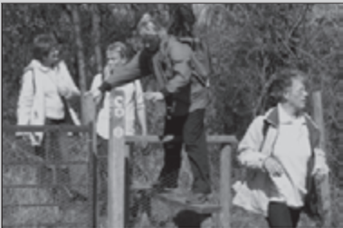
Wandelreis naar Kent PAG 20