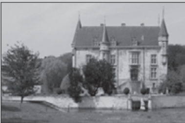
Mergelland-tocht PAG 24-25

Klauterpartijen op La Gomera (pag. 12-15)