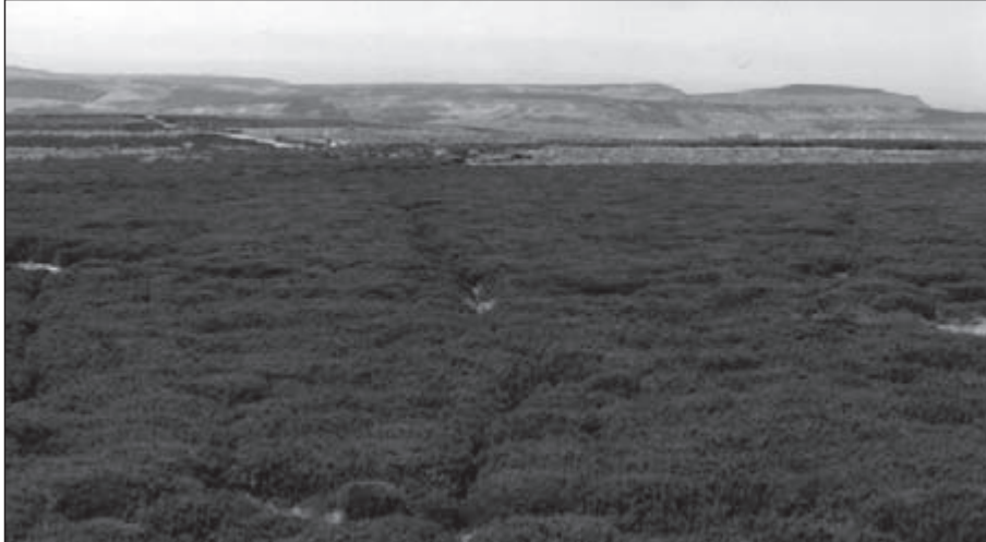
Het heidepad is soms niet meer dan een smal spoor

En als er ergens geen palen staan dan liggen er wel gegroepeerde keien dichtbij het pad, die vaak betrekking hebben op de aanwezigheid van grafheuvels uit het bronzen tijdperk. Een opmer-