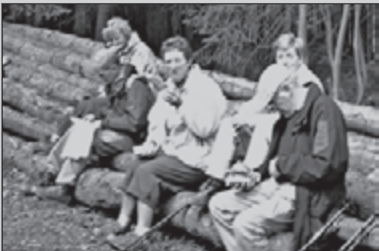
Clubreis naar Ardennen PAG 24-25